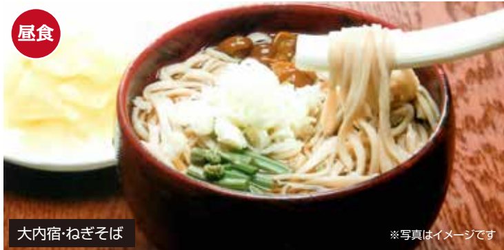
大内宿・ねぎそば

大内宿は、江戸時代に会津若松市と日光今市を結ぶ重要な道の宿場町として栄えました。現在も江戸時代の面影そのままに茅葺屋根の民家が街道沿いに建ち並び、昭和56年には国選定重要伝統的建造物群保存地区に指定されています。