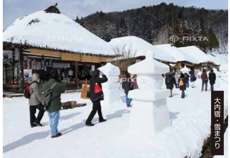
大内宿・雪まつり