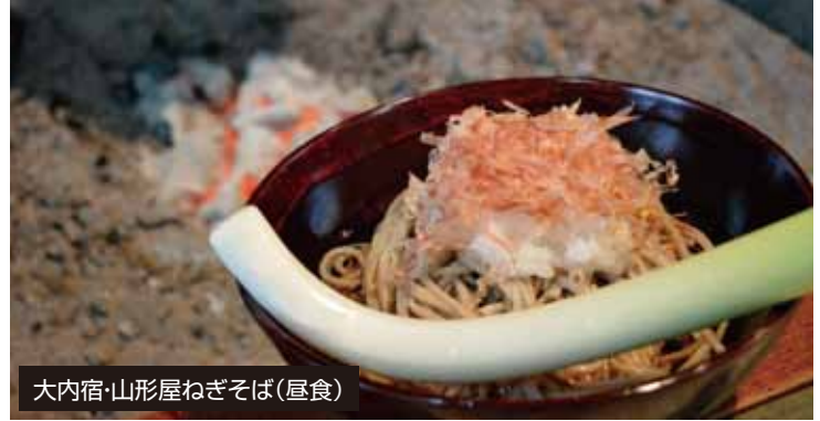
大内宿・山形屋ねぎそば(昼食)

難攻不落の名城とうたわれ、戊辰戦役で新政府軍の猛攻をしのいだ鶴ヶ城。昭和40年9月に再建され、平成23年春には幕末時代の瓦(赤瓦)をまとった日本で唯一の天守閣となりました。