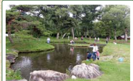
養鱒公園いこいの広場

鎌倉末期から南北朝建立といわれ南北朝様式を残す観音堂です。御蔵入三十三観音、十一番札所。