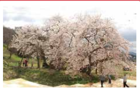
石部桜(エドヒガンザクラ) バス停から徒歩5分