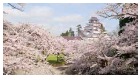
鶴ヶ城公園の桜(ソメイヨシノ) バス停から徒歩10分