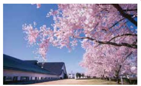
県立博物館の桜並木(コヒガンザクラ) 鶴ヶ城北口バス停から徒歩5分