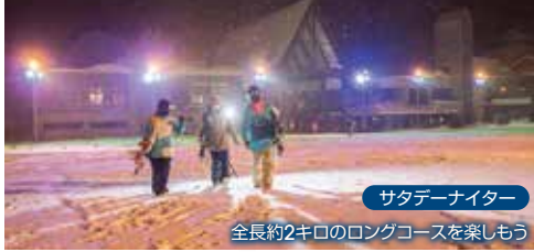
サタデーナイター